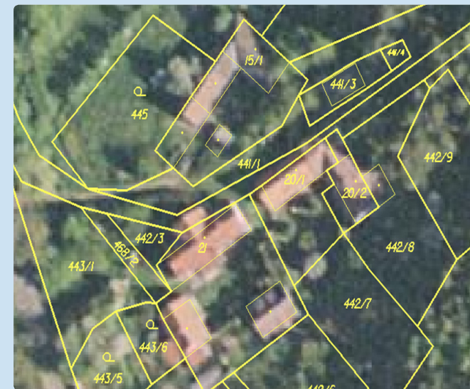
Ortofoto s obrazem katastrální mapy

Údaje o hranicích pozemků je možné zpřesnit dvěma způsoby. Pokud vlastníci mají označeny nesporné hranice pozemků v terénu (zdmi, ploty, hraničními znaky v lomových bodech), zeměměřič tyto hranice zaměří, a po porovnání s dosavadními méně přesnými údaji vyhotoví geometrický plán.